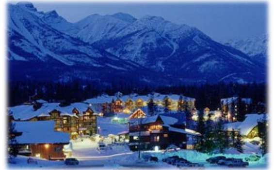
Localidad de Fernie