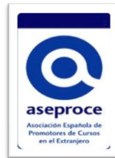
Asociación Española de Promotores de Cursos en el Extranjero